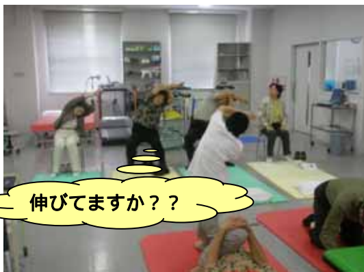
< 背中への筋肉のストレッチ >