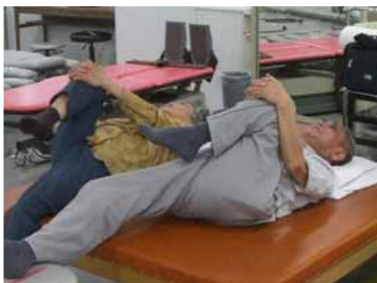
< 足の筋肉のストレッチ >