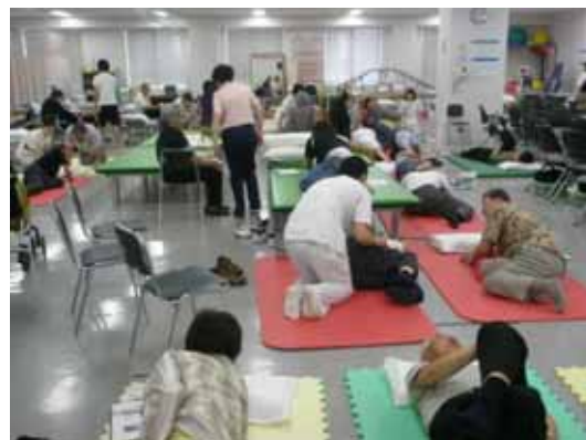
< 実技風景 >