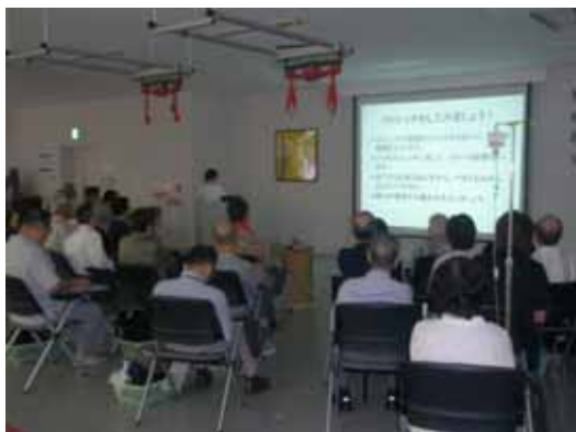
< 講義風景 >