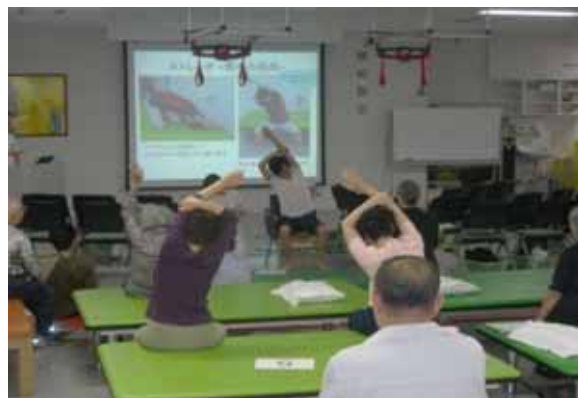
< 実技内容 >

続いて理学療法士大本より、腰痛のリハビリテーションとして背中への解剖から腰痛が起こるメカニズムについて説明をしました。その後、腰痛時の安楽肢位のとり方・自宅で簡単に出来るストレッチについて説明し、実際に参加者の皆様にストレッチを行ないました。