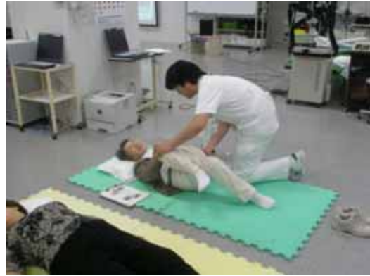
<お尻のストレッチ>