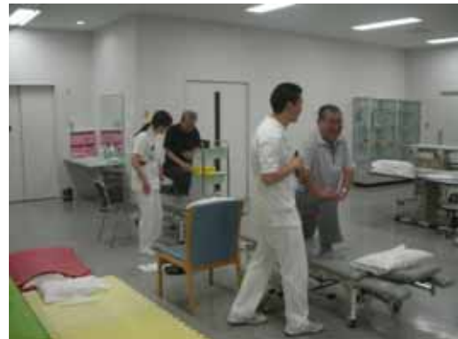
<当院理学療法士によるストレッチの指導風景>

ストレッチの実技ではグループごとに担当の療法士がついて、実際に体験してもらいました。参加者の皆様からは、「よく伸びてますねー！！」「こんな感じでいいんですか??」など声が飛び交いました。簡単なストレッチなので、実際に自宅でも行なっていただけるようです。