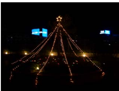
<リハビリ屋外スペースを利用してクリスマスツリーをつくりました。 薄暗くなってくるととても綺麗で、ユニバーサルスタジオジャパン に負けないクリスマスツリーとなりました>