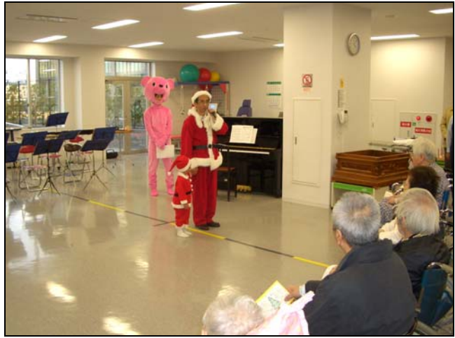
<院長の挨拶(ピンクのくま??)>