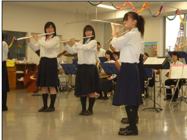
<吹奏楽で使われている楽器の紹介、楽器ごとに個性ある音色を披露して頂きました。 馴染みのあるメロディーや迫力のある演奏で、吹奏楽のみなさんに圧倒されっぱなしでした>