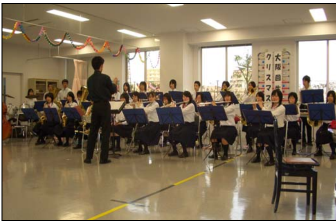
<東淀川高校吹奏楽部のみなさんによる演奏>

東淀川高校吹奏楽部のみなさんをお呼びして、盛大なクリスマス会を開催することができました。リハビリテーションセンター初めてのクリスマス会でしたが、入院中の患者様をはじめ、外来の患者様や家族の方々など約70名の方にお集まり頂きました。また、伝統あるオルゴールの懐かしい音色やクリスマスツリー点灯式、スタッフのダンスなどイベントも盛りだくさんで楽しいひとときを過ごすことができました。