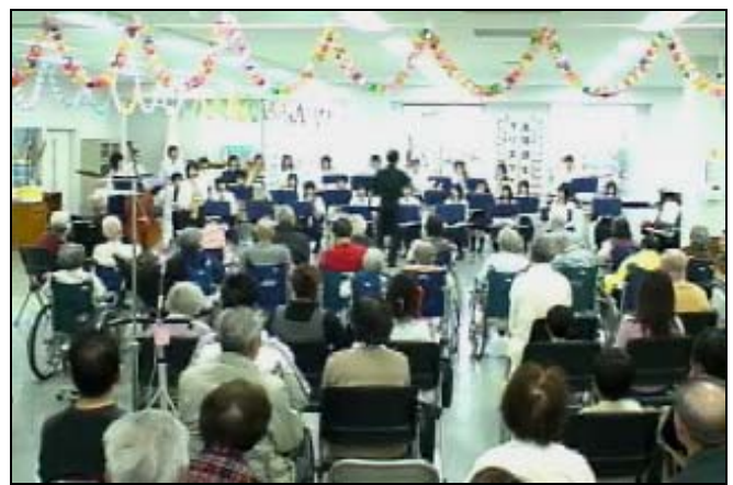
<入院、外来、家族の方々合わせ、約70名来室>