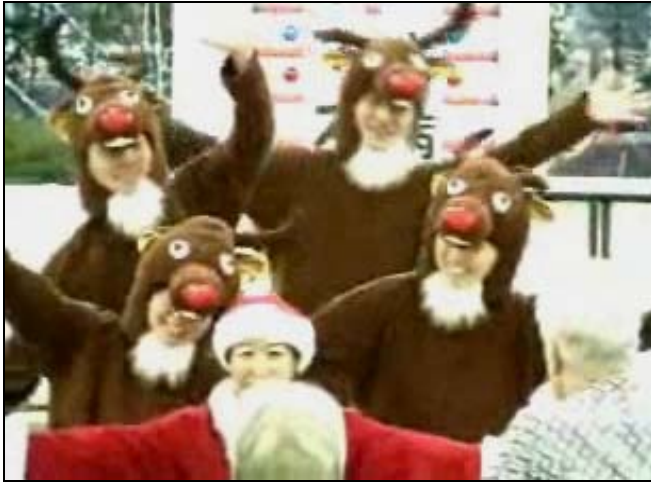
<サンタと愉快なトナカイたち>